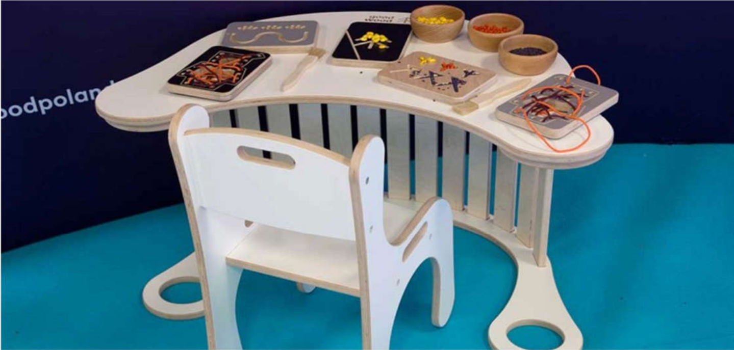
เฟอร์นิเจอร์และของตกแต่งสำหรับทารกและเด็ก