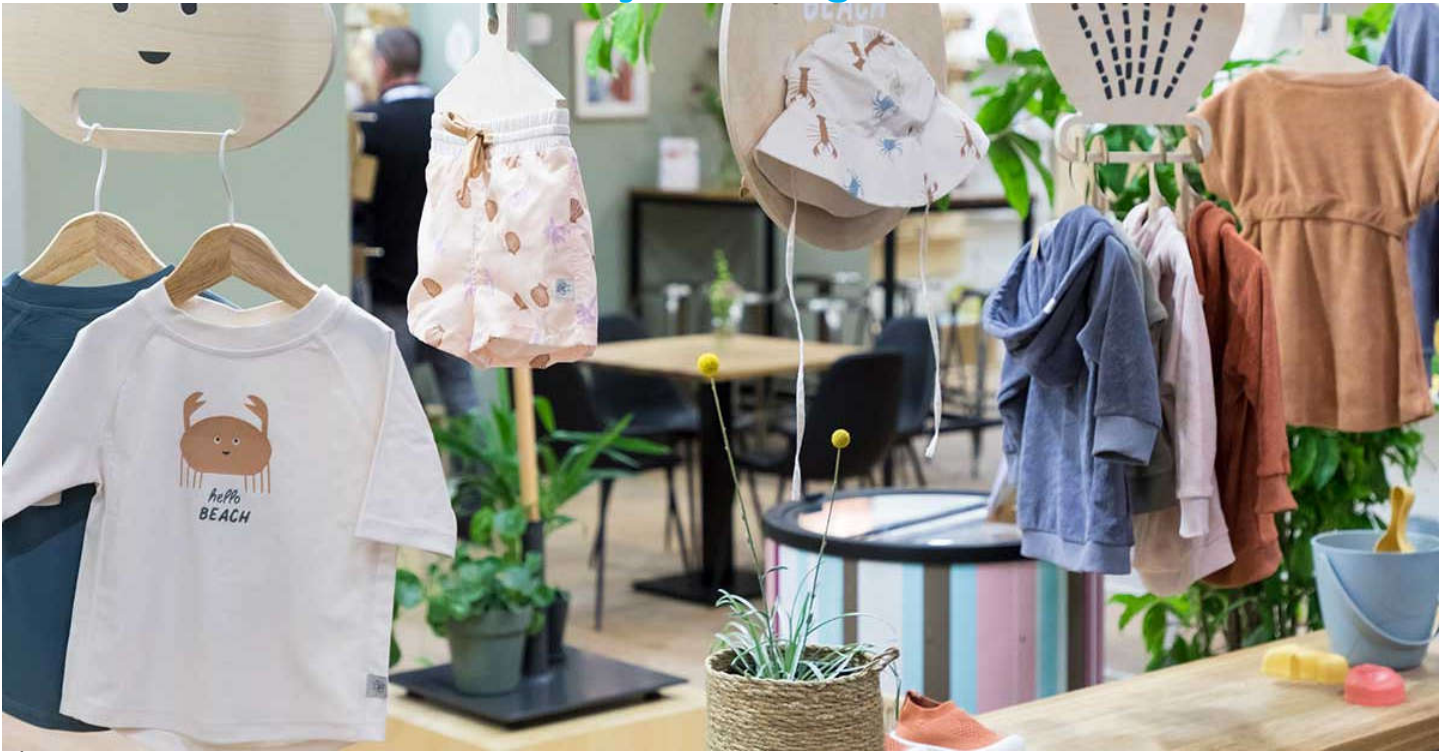
เสื้อผ้าและแฟชั่นสำหรับแม่และเด็ก